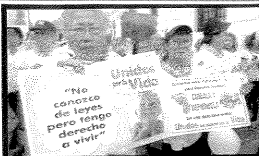
Organismos de defensa a la vida hicieron campaña para evitar la votación de la reforma en 2007 y han continuado su labor en todo el país.

El debate público continúa activo por parte de organizaciones de derechos ligadas a la Iglesia Católica