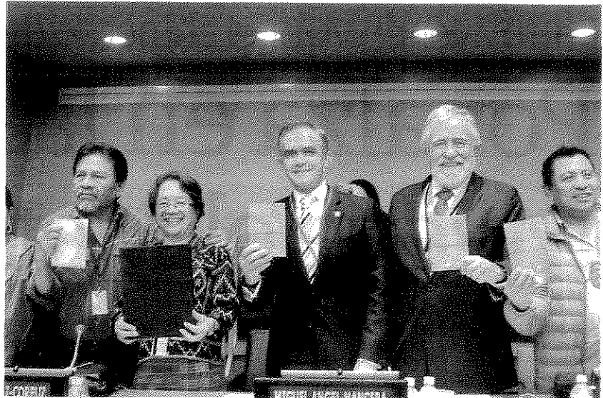
MANCERA flanqueado por Victoria Tauli-Corpuz y Alejandro Encinas, ayer.

Por lo anterior, la relatora especial de la ONU sobre Derechos de los Pueblos Indígenas, Victoria Tauli-Corpuz, afirmó que la Constitución de la CDMX debe "replicarse en otras partes