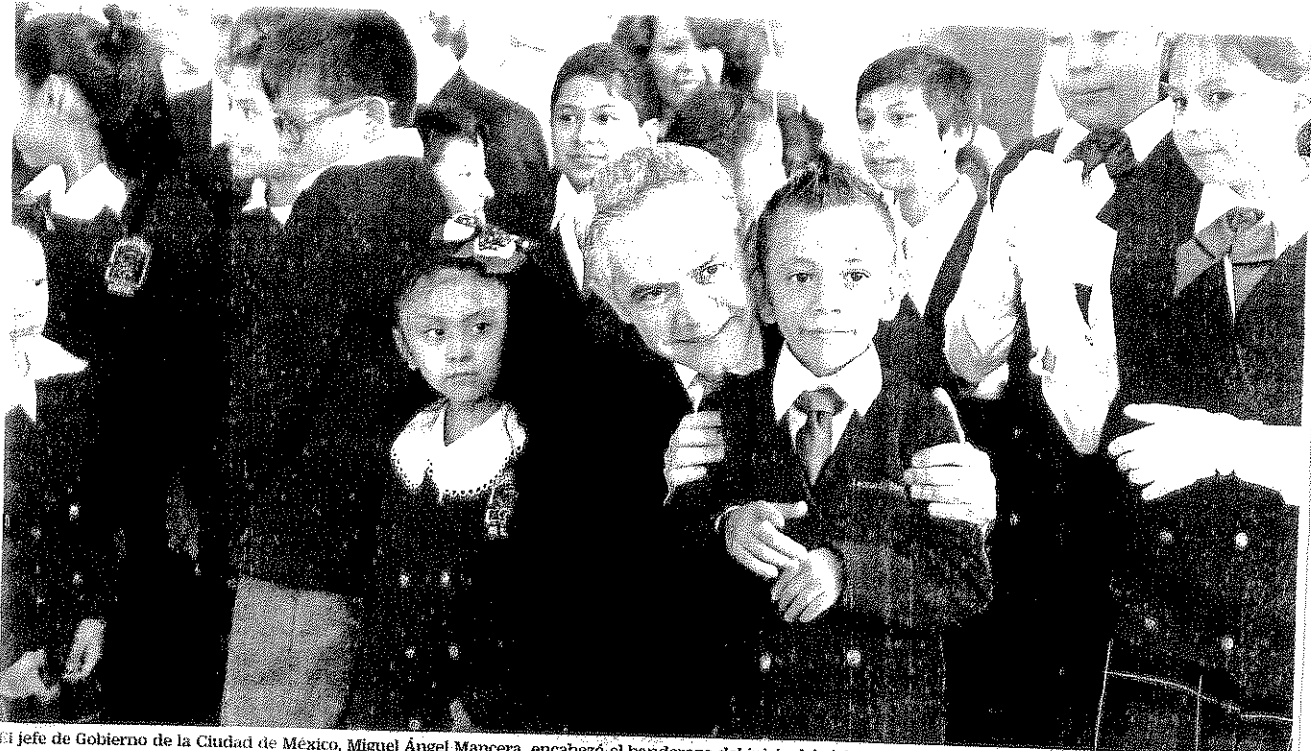
El jefe de Gobierno de la Ciudad de México, Miguel Ángel Mancera, encabezó el banderazo del inicio del ciclo escolar 2018-2019 acompañado de los alumnos de la primaria Valentín Zamora Grozco, en la colonia Roma, delegación Cuauhtémoc.