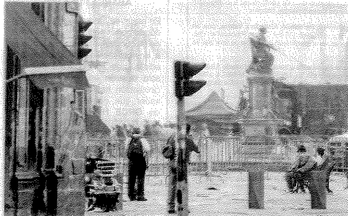
Los cierres a la circulación de vehículos y peatones, para filmar escenas de la película, se realizó el 19, 20, 21 y este 22 de agosto.

Por ejemplo, hay seis sanitarios públicos y boleterías, 19 negocios de ropa, excepto de bebé y lencería, 69 de telas, cinco dedicadas a artículos de perfumería y cosméticos, nueve de juguetes, 86 de bisutería y accesorios de vestir y 58 de otras actividades.