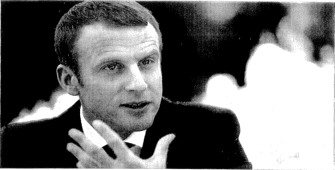
El presidente de Francia, Emmanuel Macron, el martes en la terraza del palacio del Elíseo durante la entrevista.

En la primera entrevista que concede tras asumir la presidencia, el mandatario francés esboza su visión para el futuro de Europa, con énfasis en una UE que proteja a los ciudadanos y en un presupuesto común para la zona euro