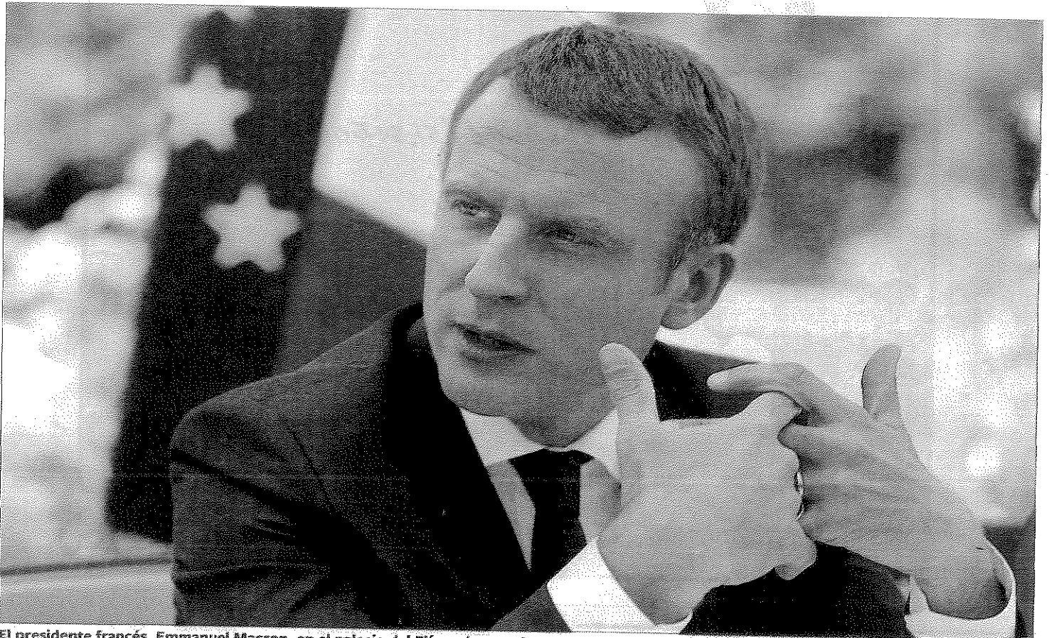
El presidente francés, Emmanuel Macron, en el palacio del Elíseo durante la entrevista con EL PAÍS y otros medios europeos.