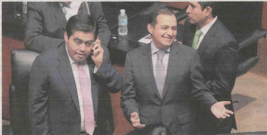
Miguel Barbosa Huerta y Ernesto Cordero Arroyo

Otro que también estará activo durante el puente revolucionario es Andrés Manuel López Obrador , quien presentará su Plan de Desarrollo 2018-2024 en el Auditorio Nacional. Antes, Morena realizará su Consejo Nacional el domingo para dar un avance de sus candidaturas y se espera que en esos días se conozca si el delegado en Cuauhtémoc, Ricardo Monreal , jugará algún papel importante en el partido o en la candidatura de Andrés Manuel, o queda conjurada la salida de don Ricardo de las filas de Morena.