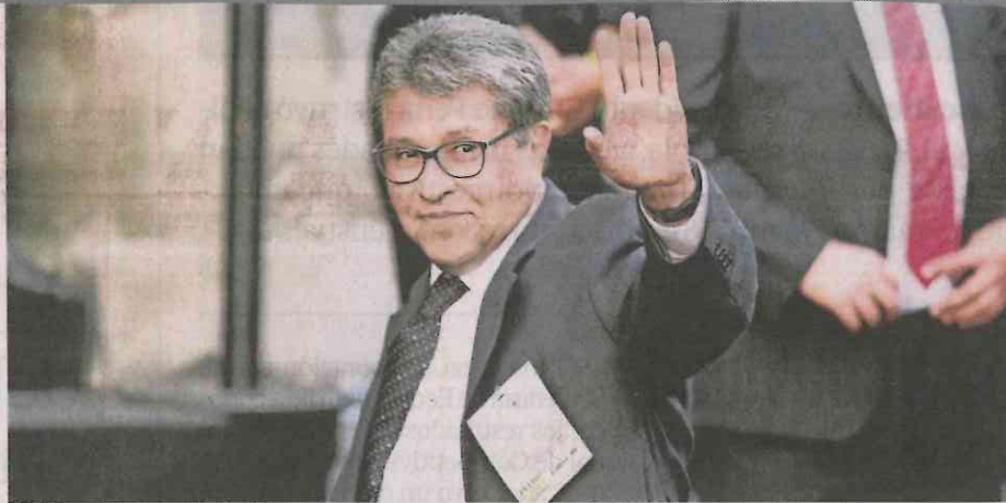
Ricardo Monreal, delegado en Cuauhtémoc en la CDMX