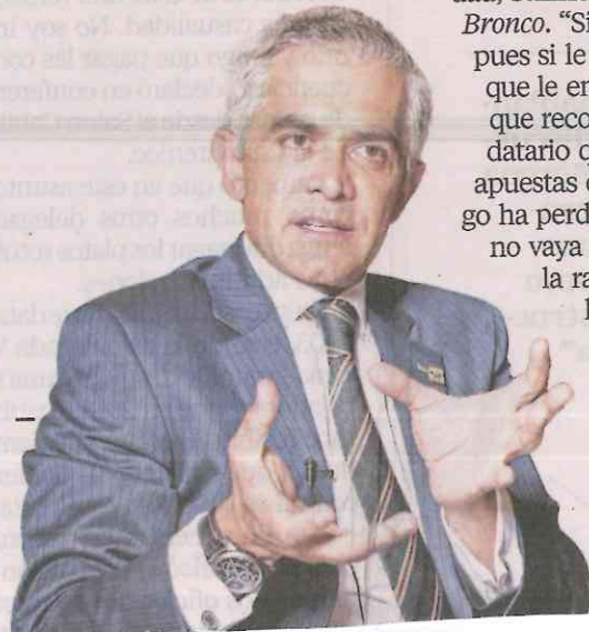
Miguel Ángel Mancera

Jaime Rodríguez, El Bronco . "Si está por ahí, pues si le quiere apostar, que le entre". Habría que recordarle al mandatario que en eso de las apuestas con su homólogo ha perdido en todas y no vaya a ser que la mala racha se le prolongue hasta 2018. ¡Hagan sus apuestas señores!