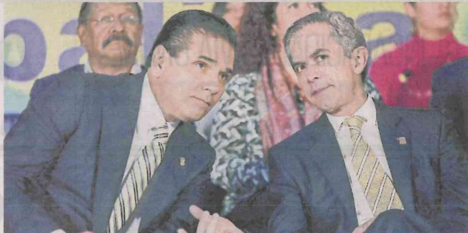
Silvano Aureoles y Miguel Ángel Mancera

En privado, el presidente Enrique Peña Nieto se toma con humor aquella frase de “faltaba un minuto, no menos, 5 minutos”. El mandatario invitó ayer al senador Ernesto Cordero —quien lo acompañó a la clausura de la 108 Asamblea General del IMSS en Aguascalientes— a la parte trasera del avión presidencial, para que conociera completa la aeronave. Ahí, el Presidente señaló al responsable de provocar ese me me y rió por completo. El día que se originó ese bullying en redes contra el mandatario, éste fue a la cabina donde viajan los periodistas que lo acompañan. Ahí hubo un diálogo muy rápido sobre cómo estaban las familias de los informadores tras el sismo del 19 de septiembre. Peña Nieto recordó que estaban a punto de aterrizar en la Base Aérea de Ixtepec, Oaxaca. “Estamos a diez minutos”, le dijo un reportero, el Presidente le respondió “no a un minuto”, otro diarista le atajó, “como a 10 minutos”, el Presidente respondió de inmediato, “no menos a cinco minutos”. El diálogo fue muy rápido y las voces de los periodistas no fueron captadas por las cámaras y teléfonos, por lo que al escucharlas parecía un razonamiento exclusivo del Presidente. Hoy, Peña Nieto ríe cuando mencionan el uno, “no menos a cinco” que lo hizo viral en las redes sociales.