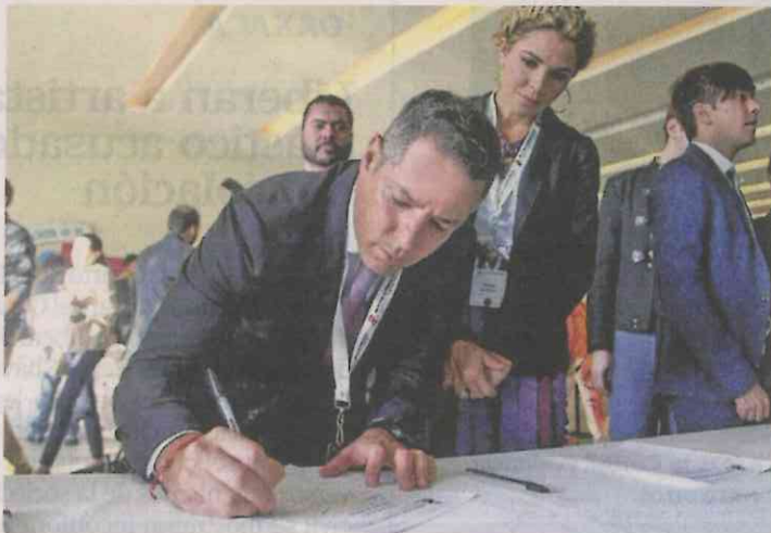
Alejandro Murat Hinojosa

misma que además ocasionó que los yaquis, que se encuentran a 200 kilómetros en la capital, la declararan persona non grata . El amuleto de la sonorenses, nos indican, tiene nombre y apellido y al parecer es tan "poderoso" que ha sido utilizado por otros candidatos de pasado "dudoso" en la entidad, algunos señalan que sirve para llegar a la Presidencia. ¿Cómo se llamará?