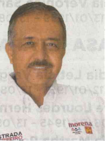
Jesús Estrada Ferreiro

En Culiacán, Sinaloa, nos comentan, los morosos están más temerosos que nunca, esto luego de que el alcalde electo, Jesús Estrada Ferreiro (Morena, PES, PT) señalara que no va a conceder condonaciones, ni borrón y cuenta nueva a los adeudos del impuesto predial o consumo del agua potable. La medida, nos dicen, estremeció a quienes viven en los fraccionamientos más exclusivos de la capital del estado, donde los consumos son muy altos y se conoce que habitan los mayores deudores. Ahora sí, nos indican, les llegó la hora de pagar.