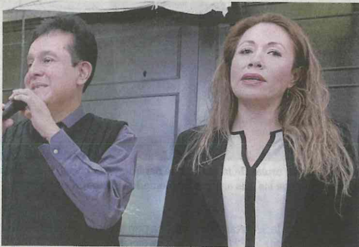
TOPIARCA DE TAVITTED

encaminarse a que sea trasladado a un penal federal. Es decir, en vez de pensar en una defensa para tratar de que quede en libertad, lo más práctico sería buscar ponerlo a salvo de sus enemigos.