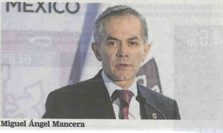
Miguel Ángel Mancera

Ahora que el presidente electo, Andrés Manuel López Obrador , ha dicho que buscará una política de Estado en materia de austeridad que incluya a los Poderes Ejecutivo, Legislativo y Judicial, nos comentan que en el Senado ya le tienen lista a los coordinadores de las bancadas entrantes una propuesta de programa de Austeridad y Racionalidad en el Gasto. Aunque aseguran que la tijera republicana se defenderá hasta donde sea "justo y necesario" para que la Cámara Alta funcione bien y sin excesos. Nos adelantan que uno de las recomendaciones es que se puede lograr una buena poda de dispendios en el caso de las comisiones, aseguran que se puede prescindir casi de la mitad de ellas sin que suceda nada grave. Esa, nos comentan, es una parte de la receta para la austeridad.