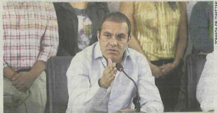
TOMADA DE TWITTER

Entre los líderes del PRD tampoco cayeron nada bien las declaraciones del coordinador nacional de Movimiento Ciudadano, Dante Delgado , para evitar que Ricardo Anaya , precandidato de la coalición Por México al Frente, pudiera responder las preguntas de los reporteros en su registro como abanderado del llamado partido naranja . Un líder del sol azteca reconoció: "se equivocó, pero ya le dieron una lección", al recordar la crítica que le llovió a Dante.