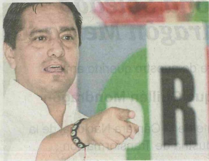
TOMADA DE TWITTER