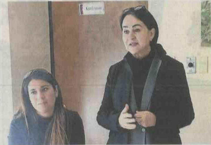
TOYARDA DE TWITTER