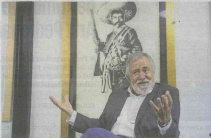
Alejandro Encinas Rodríguez

narcotraficantes, lo que amenaza con convertir a la Zona Metropolitana en una tierra de nadie si las autoridades no reaccionan.