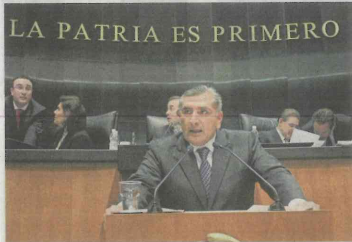
Adán Augusto López

del IMSS, quienes se cuestionan cuánto debe ganar el líder gremial como para llenar a su familia de lujos, mientras a médicos y enfermeras sus sueldos "apenas y les alcanzan". En tanto, nos aseguran, los empleados de salud le prenden su veladora al próximo gobierno de Andrés Manuel López Obrador para que ponga lupa a los recursos de los sindicatos y sus dirigentes.