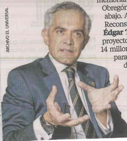
Miguel Ángel Mancera