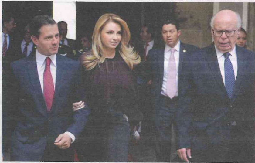
EL PRESIDENTE Enrique Peña, la primera dama, Angélica Rivera de Peña, y el titular de Salud, José Narro, ayer, en la cumbre.

"Para asegurar que las familias de menores ingresos puedan ejercer su derecho a la salud, este Gobierno ha cubierto por medio de un programa de política social que tenemos en nuestro país, el Seguro Popular, el tratamiento de casi 129 mil casos de cáncer", señaló.