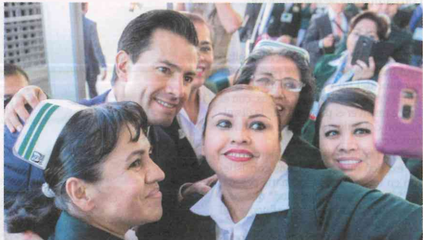
EL MANDATARIO con enfermeras del Seguro Social, en Aguascalientes, ayer.

EL PRESIDENTE afirma que en lo que va de su gestión se han creado 3 millones 328 mil puestos; inaugura hospital en Aguascalientes y prevé estrenar 12 más en 2018