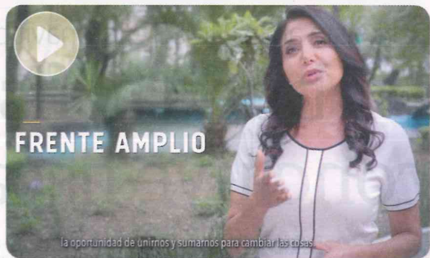
BARRALES, en uno de los tres spots en los que figura.

LA PRESIDENTA del sol azteca encabeza campaña nacional en la que es personaje central; se mencionan como aspirantes a Ahued, Chertorivski, Mercado y Granados