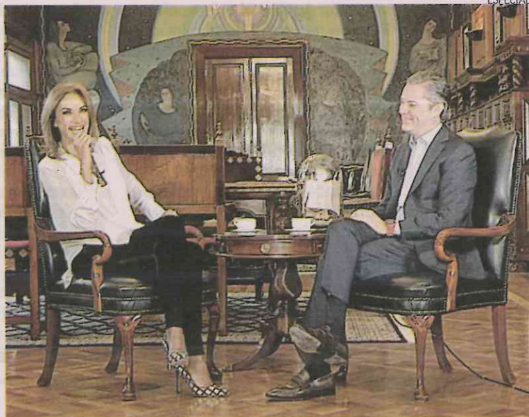
POR ADELA. La periodista Adela Micha charló con el secretario de Educación Pública, Aurelio Nuño Mayer.

Pero hay otros muy entusiasmados, se le inquirió. “Eso será bronca de otros, no te puedes distraer, no puedes caer en esa trampa, es un grave error”, insistió.