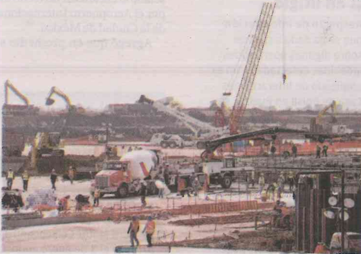
Obras de la nueva terminal aérea.