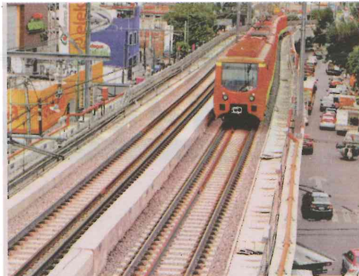
La Línea Dorada va de Tláhuac a Mixcoac.

Comentó que se puede revisar la planeación, contratación y entrega de cada obra a cargo de dependencias, entidades y delegaciones. M