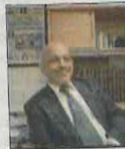
Francisco Báez Rodríguez

Mancera quedó mal con ellos y, por más que queramos ponderar muchas de sus buenas acciones al frente del gobierno de la ciudad, eso significa que carga con un lastre pesado, muy pesado, en sus aspiraciones rumbo al 2018.