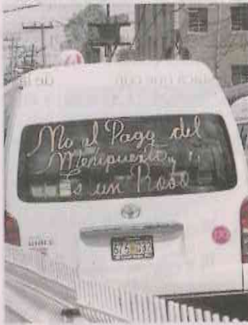
REBECA JIMÉNEZ EL UNIVERSAL