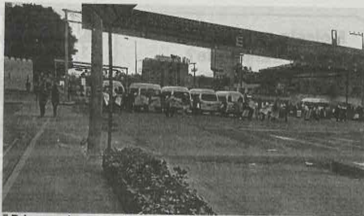
■ Primero abusaron de pasajeros y ahora se dicen afectados

unidades exigieron que se les baje la cuota establecida para su ingreso al Mexipuerto toda vez