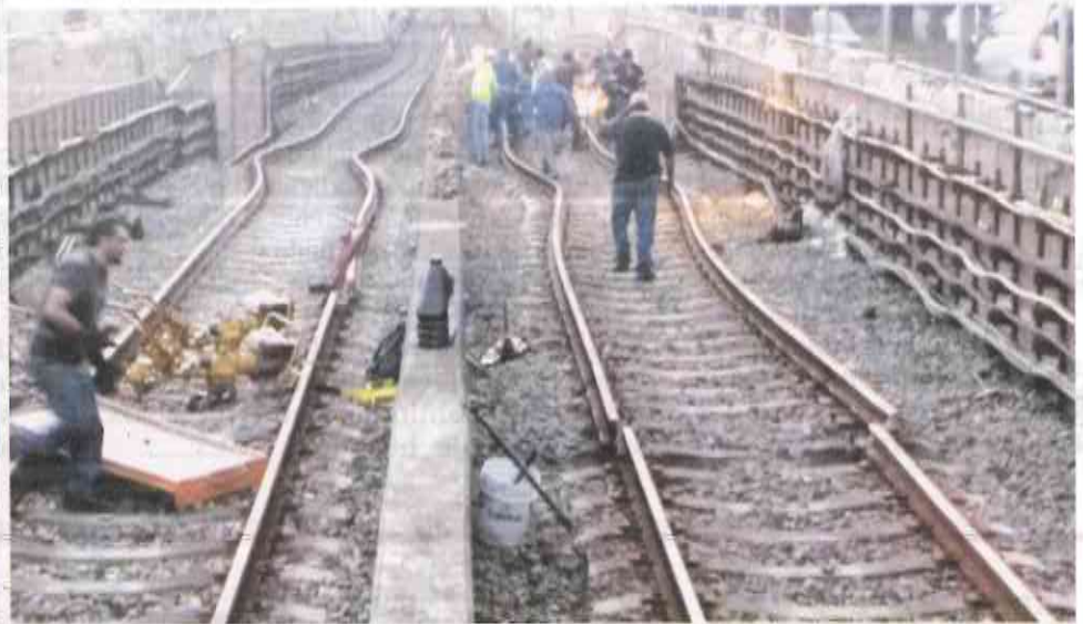
DAÑOS. Una de las columnas de soporte de la Línea 12 tuvo afectaciones, así como las vías.