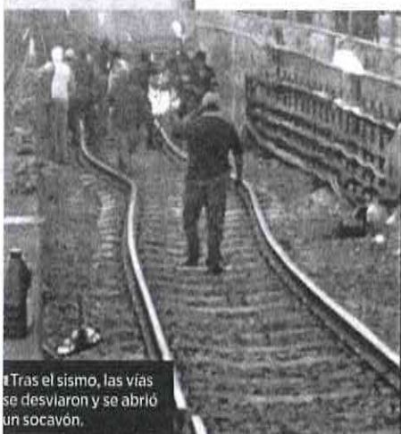
Tras el sismo, las vías se desviaron y se abrió un socavón.