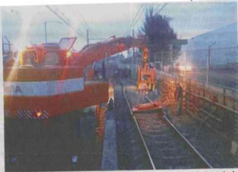
Autoridades realizan trabajos de reparación en las vías de la L12, después de que la circulación de trenes se interrumpió por las afectaciones.

Personal de este organismo trabajó durante toda la noche para rehabilitar los puntos críticos, y el miércoles comenzó a operar con normalidad la Línea A. Sin embargo, el STC indicó que en la Línea 12 se detectó una falla estructural en una columna, es decir, hay un daño en el corazón de esta estructura ubicada en el tramo Nopalera-Olivos, lo que debilita su funcionamiento integral en el soporte de peso y de elasticidad.