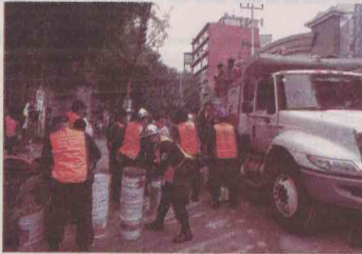
No se suspenderán las labores de rescate en la CDMX.

cias o ellos se ofrezcan a retirar sus pertenencias. De ninguna manera".