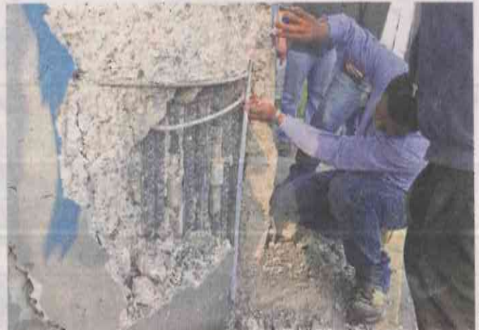
■ Luego de encontrar fallas en el armado de columnas, se hará una inspección en 300 de estas estructuras.

“Se detectó un vicio oculto, es decir, una falla en el