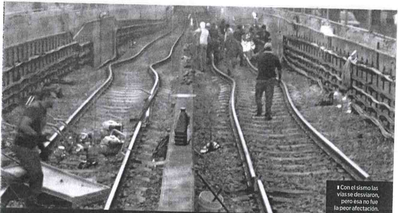
Con el sismo las vías se desviaron, pero esa no fue la peor afectación.