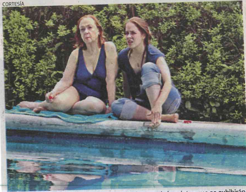
No quiero dormir sola , de Natalia Beristáin es una de las cintas que se exhibirán