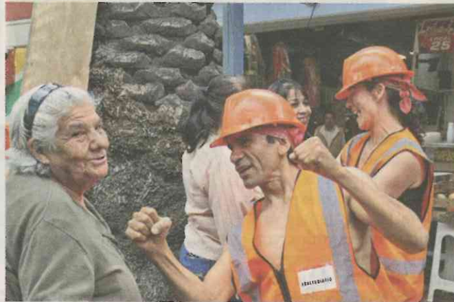
Los danzantes, impulsados por el INBA, vistieron de obreros para la obra, en la que convivieron con locatarios y clientes.

Hasta el área de fondas llegó la interpretación de la obra “Hombres trabajando” y sin interrumpir la hora de