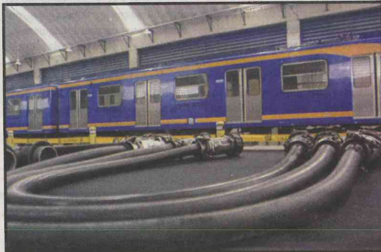
Se Ahorrarán gastos en reparaciones.