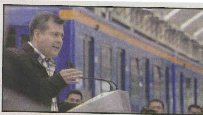
Se Ahorrarán gastos en reparaciones.