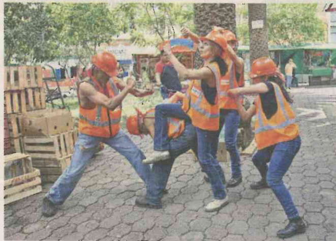
Con una bocina portátil en mano, jóvenes presentaron la obra “Hombres Trabajando” en los pasillos y jardines del mercado.

la comida de los comensales en las mesas del mercado, los danzantes personificados de obreros representaron en un instante el momento en que, después de una larga jornada, se sientan a reposar y a degustar un patillo.