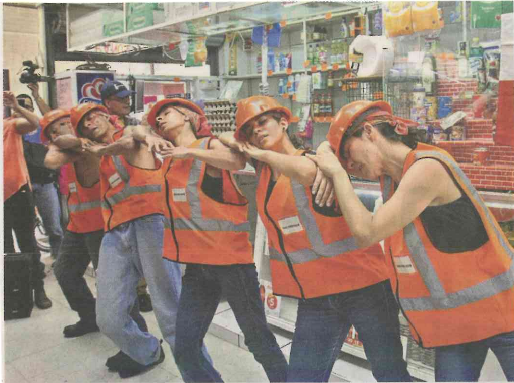
■ Bailarines llevan sus obras a tianguis, mercados, cruceiros y estaciones del Metro.