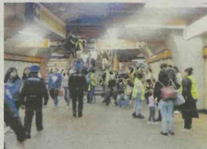
ESPECIAL / INSTAGRAM

La serie, que se graba desde hace varios meses entre Europa y Colombia con un renovado elenco, verá la luz a principios del próximo año.