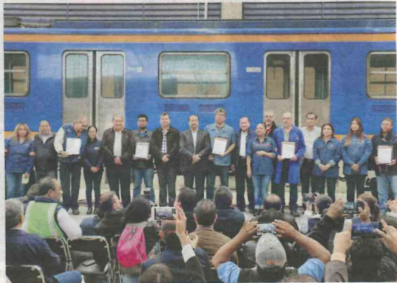
El mandatario local inauguró el nuevo taller de reparación de trenes de la Línea A

Sin embargo, en la actual administración —que está por concluir— únicamente se construyeron 4.5 ki-