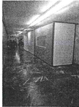
Locales en lugares prohibidos, poner en riesgo a usuarios.

En seguimiento a nuestro desplegado publicado en el periódico Excelsior, el pasado 03 de agosto de 2018, y en respuesta a las afirmaciones realizadas por el diputado local Ernesto Sánchez Rodríguez, quien señaló que mi persona se ha dedicado a sembrar el miedo entre las autoridades en reclamo de espacios comerciales, me permito señalar lo siguiente: