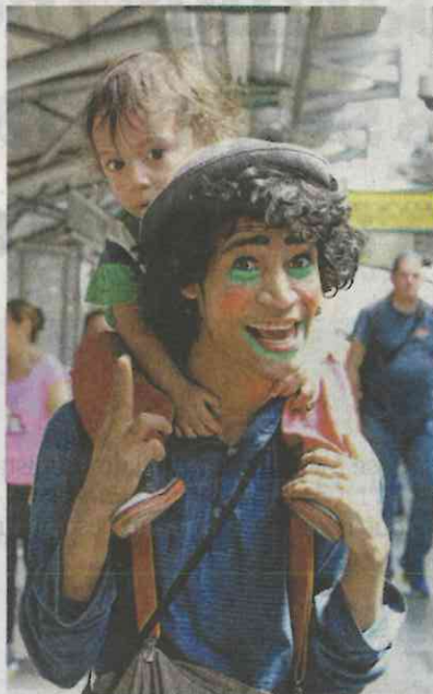
A los líderes de este proyecto le interesa impulsarlo en el extranjero.

“Los permisos [para tomar fotos en el Metro de la Ciudad de México] son difíciles de tramitar, lo hemos intentado hacer”