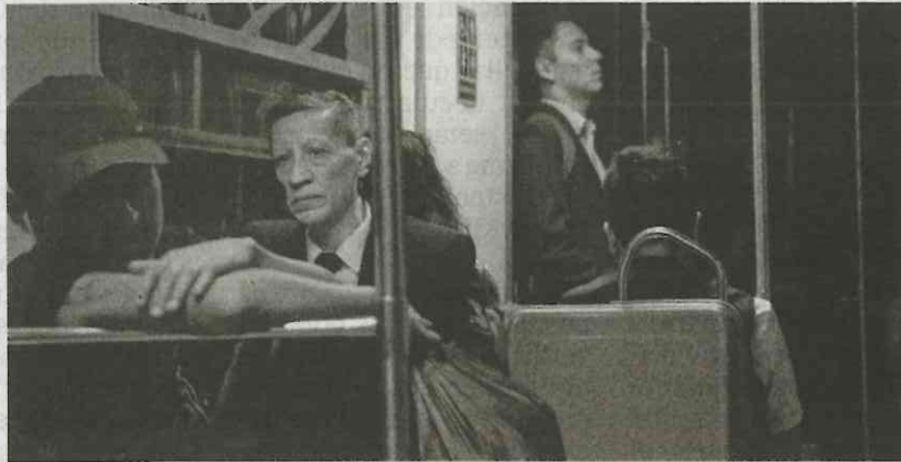
Los dirigentes de Metro Chilango se hicieron llamar jefes de estación, haciendo referencia a los puestos de mando del Metro.