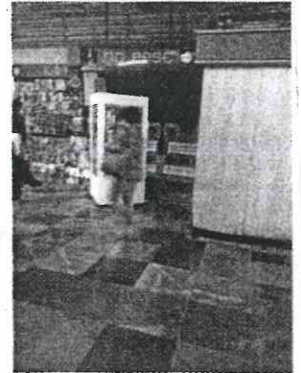
Legalización de ambulanteaje.

Al respecto, quiero corregir al asambleísta. Lo que este grupo de trabajadores del metro -y yo como su representante- estamos pidiendo es precisamente que no se otorgue ningún espacio comercial más, ya que se está poniendo en grave riesgo la seguridad de los usuarios y la operatividad del metro. En ningún caso buscamos presionar a nadie, lo importante y la consigna es que se audite a la actual administración del STC, en materia de permisos administrativos y que en tanto esto ocurra no se otorgue ningún espacio comercial más.