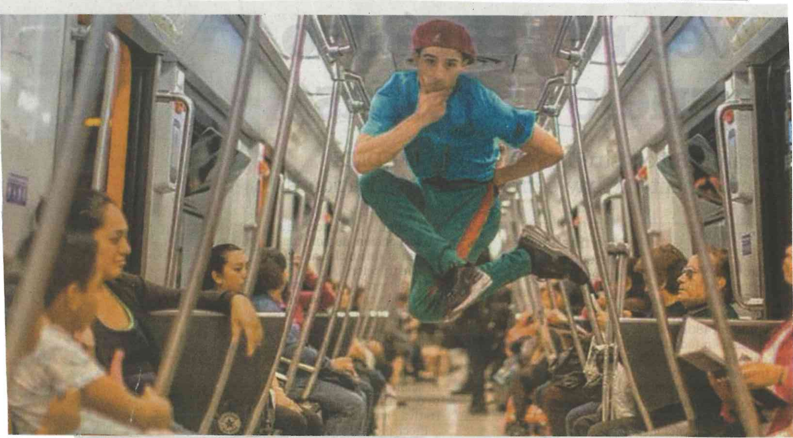
El obstáculo que Metro Chilango enfrenta es que dentro de las instalaciones está prohibido tomar fotos si no se consigue un permiso, aunque hasta la fecha no han tenido problemas.