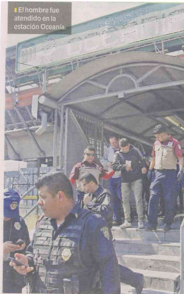
■ El hombre fue atendido en la estación Oceania.