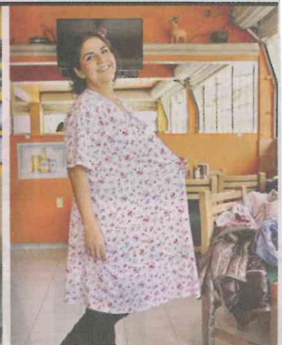
La estudiante de Comunicación bajó 32 kilos tras someterse a una cirugía bariátrica.

tro ya ocupaba casi dos asientos. Salir de los torniquetes representaba un reto mayor.