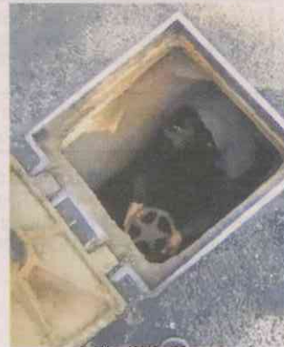
■ El suministro no mejora si no se revisan las válvulas.

pozo llamado ‘El Cazo’, de ahí no nos han dado una respuesta para atender nuestra falta de suministro por la toma de San Antonio”, contó el vecino.