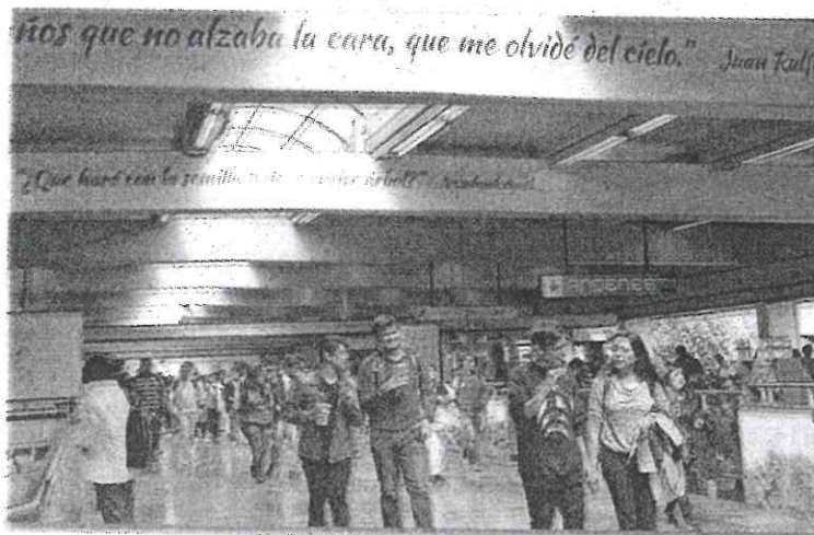
Usuarios y estudiantes que transitan por la estación Universidad de la Línea 3 del Metro podrán admirar la muestra permanente sobre los 100 años de historia de la UNAM.

Finalmente, quienes recorran la estación Universidad podrán leer algunas de las frases más reconocidas de personajes, como el educador y filósofo mexicano José Vasconcelos, además de los escritores Carlos Fuentes y José Emilio Pacheco, entre otros.