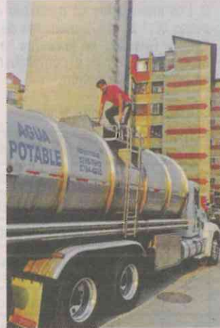
■ Los afectados compran pipas particulares.

“A excepción de la reparación de la bomba de un