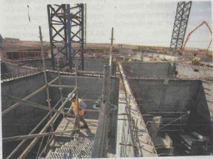
Los trabajos de construcción de la nueva terminal aérea.