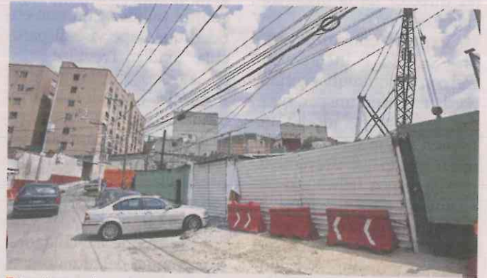
La dependencia recordó que se realizan supervisiones notariadas en los inmuebles colindantes.

Habitantes entrevistados sostuvieron que desde hace dos meses, cuando iniciaron