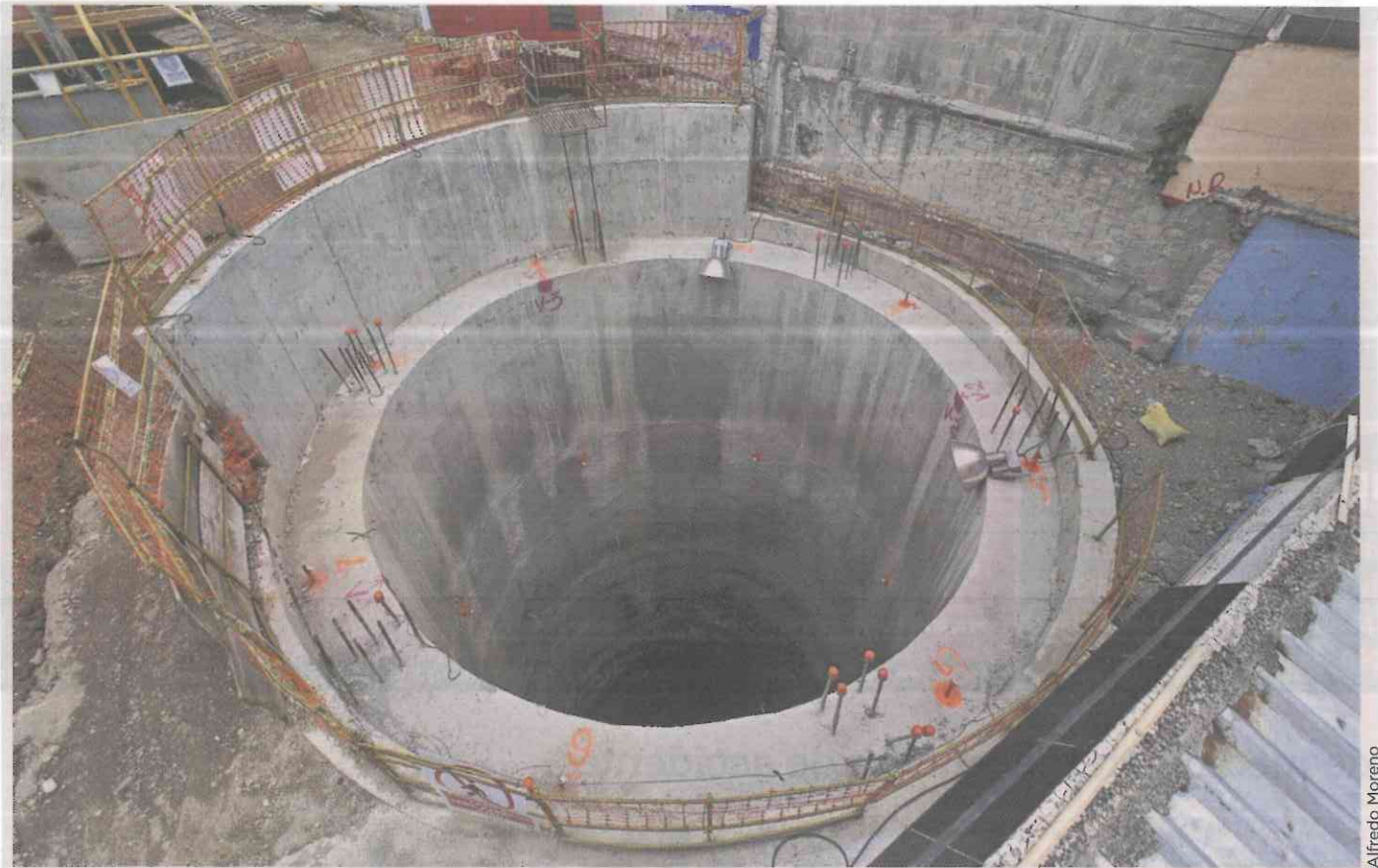
■ La ampliación de 4.6 kilómetros de la Línea 12 se realiza con un método constructivo seguro, aseguró la Secretaría de Obras.