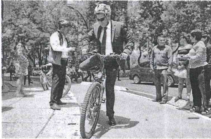
El jefe de Gobierno se trasladó a su despacho en bicicleta.