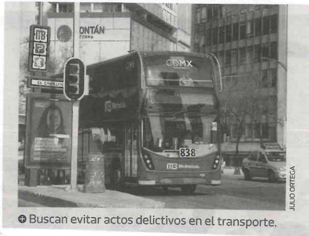
⊕ Buscan evitar actos delictivos en el transporte.

Al respecto, la Comisión de Derechos Humanos de la Ciudad de México precisó que no se le deberá negar el servicio a ningún usuario que porte las prendas referidas.