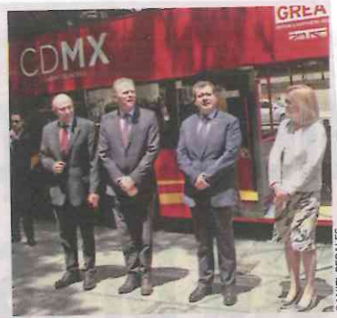
VISITA. El embajador Duncan Taylor y el jefe de Gobierno, en la Línea 7.

“Todas las personas que en el momento de acceder al Metrobús traigan gafas de sol, gorras o capuchas, les vamos a pedir que por favor se las puedan retirar para que se puedan registrar en las cámaras. Después, en el trayecto, podrán continuar con el uso de sus prendas”, explicó en un recorrido por la Línea 7 del Metrobús.