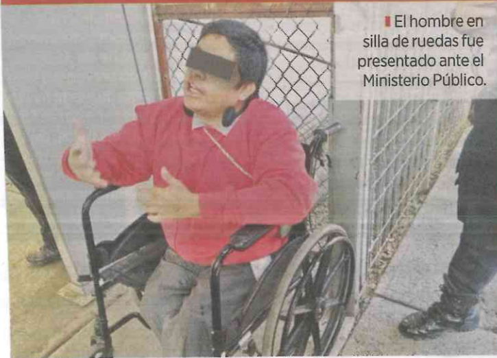
■ El hombre en silla de ruedas fue presentado ante el Ministerio Público.