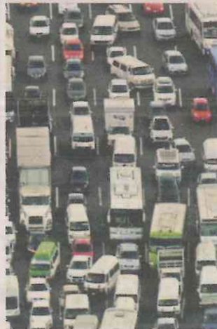
El tráfico en la Capital agobia a los ciudadanos.

sentado la próxima semana con el patrocinio de la empresa de transporte Jetty, en el Centro Cultural Digital Estela de Luz, tras haber sido exhibido en el Festival de Cine de Morelia y en el Festival de Cine Documental Ambulante.