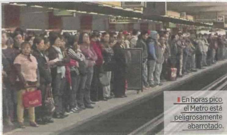
En horas pico el Metro está peligrosamente abarrotado.