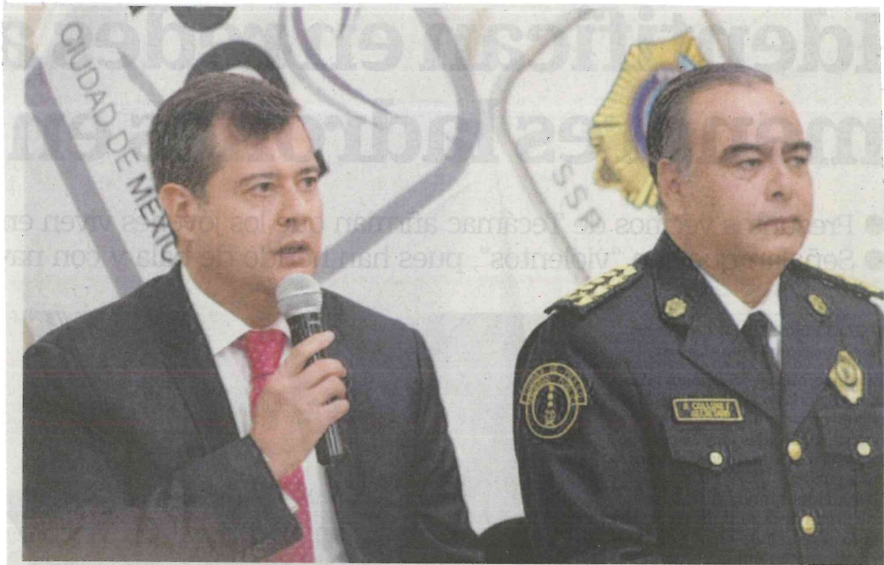
El mandatario capitalino, José Ramón Amieva, y el secretario de Seguridad Pública de la CDMX, Raymundo Collins, en conferencia de prensa, aseguraron que el uso de armas es un problema "grave".

consideren no importa el calibre del arma, pues la víctima, al momento del robo, no distingue si el objeto es un arma de verdad, una replica o de juguete. Todas ejercen el mismo daño, pero los jueces no lo ven así", comentó el Amieva al momento de dar a conocer la iniciativa de iniciativas.