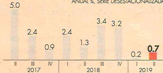
Actividad económica capitalina | VARIACIÓN ANUAL %, SERIE DESESTACIONALIZADA

En el primer semestre, la economía capitalina aceleró, aunque con tasas anuales menores a 1 por ciento.