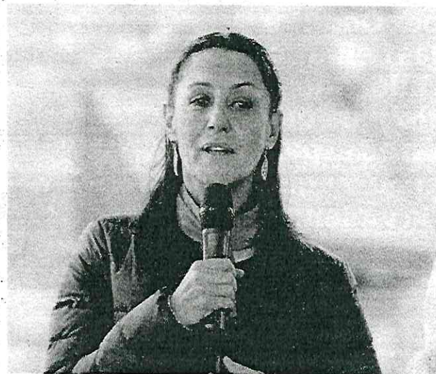
Claudia Sheinbaum prometió agua para todos antes de terminar su sexenio.

Claudia Sheinbaum prometió mejorar la instalaciones de las plantas de bombeo para mejorar el suministro de agua en la capital del país