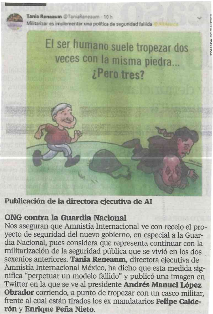
Publicación de la directora ejecutiva de AI

Y a propósito del Poder Judicial, hoy, en un hecho inédito, los jueces y magistrados federales en la Ciudad de México realizarán un acto de protesta y darán lectura a un mensaje nacional. La convocatoria ocurre en medio del choque entre el Poder Judicial de la Federación, el Ejecutivo y la representación de Morena en el Legislativo por la aplicación de la Ley Federal de Remuneraciones. Al contexto se sumó la resolución del Tribunal Electoral que avaló el triunfo de la panista Martha Érika Alonso como gobernadora de Puebla, sobre el morenista, Miguel Barbosa , fallo que ayer mismo fue descalificado por el presidente de la República, Andrés Manuel López Obrador , quien lo consideró "antidemocrático" aunque también dijo que lo respetará. Guerra entre poderes.