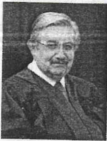
Luis María Aguilar

ARCHIVO EL UNIVERSAL La confrontación entre el Poder Ejecutivo y parte del Legislativo con el Judicial, nos dicen, tendrá su impacto en el proceso de sucesión de la Suprema Corte de Justicia. Nos hacen ver que esta situación servirá para ver quién de los cuatro ministros que están compitiendo por suceder al actual presidente de la Suprema Corte de Justicia de la Nación, Luis María Aguilar , tiene el perfil y estilo necesario para velar mejor por los intereses del Poder Judicial. Al menos dos de los cuatro ministros presidenciables, Alberto Pérez Dayán y Jorge Mario Pardo Rebolledo , han acaparado la atención de los medios en estos días del