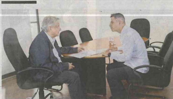
Andrés Manuel López Obrador y Alejandro Murat

Nos recuerdan que el pasado 23 de noviembre, el líder de los senadores morenistas, Ricardo Monreal , señaló que el presupuesto entre el Senado y la Cámara de Diputados, sería 25% menor al de otras legislaturas. Sin embargo, al hacer las cuentas el día de ayer sólo se llegó a un recorte de 16%. Nos hacen ver que ahora van a tener que cumplir con lo prometido, pues el anuncio del ahorro de 25% se dio con mucho ruido mediático por lo que meter reversa sería muy costoso en momentos en que los legisladores de Morena mantienen un diferendo con el Poder Judicial. Todo indica que los legisladores tendrán que aplicar más medidas de austeridad, por lo menos en San Lázaro, ya que ahí los diputados se dejaron intacto su sueldo base y su gratificación de fin de año.