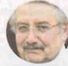
Luis María Aguilar, ministro

Lo relacionado con la Ley de Remuneraciones de Servidores Públicos se revisará en la SCJN hasta enero, ya que los ministros tenían hasta el viernes pasado para solicitar que se sesionara de forma extraordinaria y analizar el recurso de reclamación. Sin embargo, ninguno de los ministros levantó la mano, por lo que la discusión tendrá que esperar.