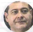
José Ramón Amieva

Impecable trabajo realiza el jefe de Gobierno, José Ramón Amieva, a escasos días de dejar el cargo. Junto con la Conagua, actuó oportunamente para que el megacorte de agua no se convirtiera en crisis; atendió en todos los sentidos a la caravana migrante, y mantiene la coordinación con el gobierno federal. Va a entregar buenas cuentas, nos dicen.