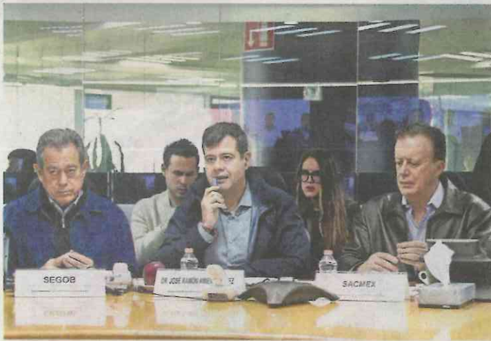
José Ramón Amieva