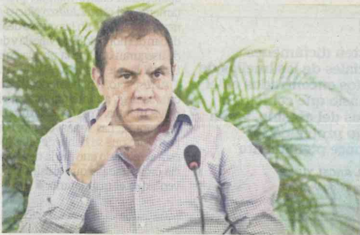
Cauhtémoc Blanco Bravo

ro, mientras que el titular de Gobernación, Alfonso Navarrete Prida , el único en acompañarlo, abandonó el Centro de Convenciones mucho antes de que el gobernador terminara de hablar. Así, nos señalan, se trató de un evento deslucido, sin las grandes figuras políticas que años atrás habían respaldado al perredista, el primer gobernador que tuvo la izquierda en el Edén. ¡Auch!