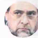
Jorge Pardo Rebolledo

Este lunes inicia el desahogo de las impugnaciones en contra de la Ley de Seguridad Interior y todo apunta a que la Suprema Corte avalará la participación de las Fuerzas Armadas en tareas de seguridad pública, aunque con algunos candados, según el proyecto de dictamen del ministro Jorge Mario Pardo Rebolledo. Algo muy parecido a lo que ya dijo López Obrador.