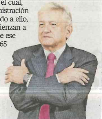
A. Manuel López

Mañana, nos platican, se celebrará en Mérida una reunión entre los ocho gobernadores del sureste de México, con el presidente electo Andrés Manuel López Obrador , quien desde el pasado fin de semana se encuentra en Campeche. El tema, nos explican, será la realización del Tren Maya, el cual, dijo, será promovido por su administración una vez que tome posesión. Aunado a ello, nos cuentan, en la península comienzan a ponerse de manteles largos, ya que ese mismo día, don Andrés cumplirá 65 años, y muchos de sus cercanos, entre simpatizantes y militantes de Morena, esperan felicitarlo y de paso poder hacerle un pachangón. ¡Mare!