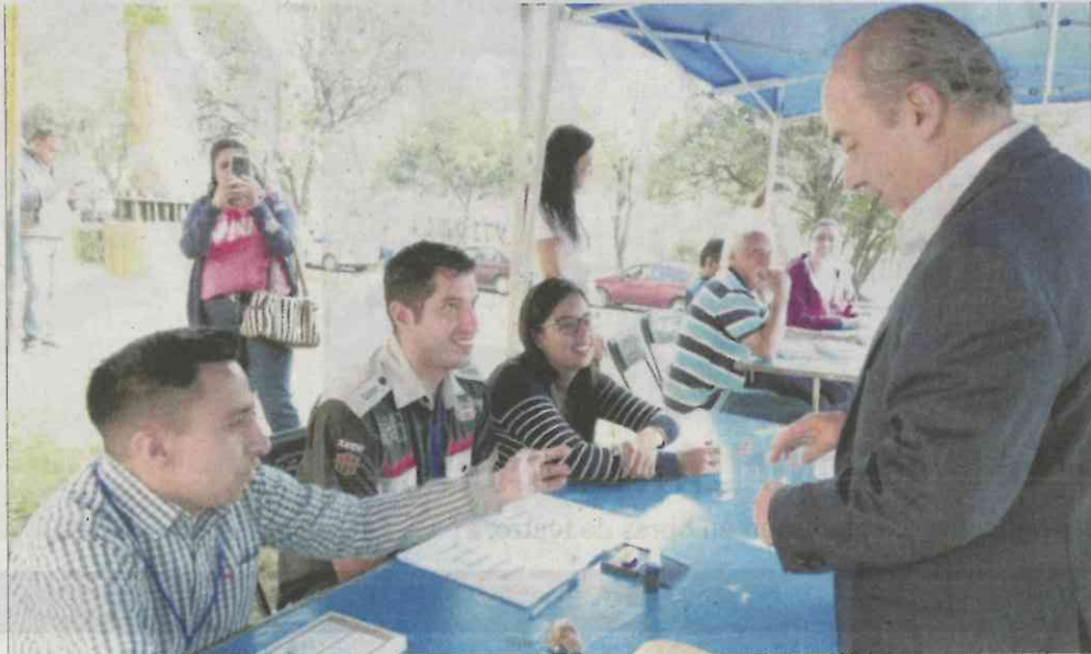
Felipe Calderón participó en la elección de dirigente del PAN