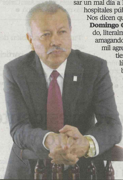
TOMADA DE REDES

Nos cuentan que el Sindicato de Trabajadores de la Salud en el Estado de México tiene todo listo para desquiciar las vialidades de la ciudad de Toluca este próximo lunes, y de paso hacerle pasar un mal día a los usuarios de los hospitales públicos de esa entidad.