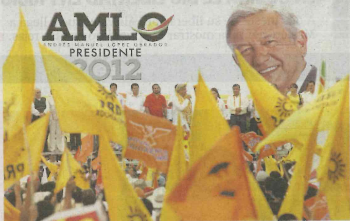
AMLO, en 2012, en campaña por la Presidencia

Nos cuentan que la medida de liquidar a sus aproximadamente 200 empleados de base en el PRD fue provocada, principalmente, por una multa que les impuso el INE a los amarillos de 125 millones de pesos, derivada del proceso electoral de 2012, donde Andrés Manuel López Obrador , ahora presidente electo, fue su candidato presidencial. Nos cuentan que a partir del pasado mes de agosto, el PRD comenzó a pagar esta multa, lo que redujo a 50% las prerrogativas del sol azteca. De qué tamaño será la crisis política y financiera en el PRD que hasta su propio presidente nacional, Manuel Granados , está pensando renunciar a sus 38 mil pesos de sueldo mensual para que el partido siga a flote. Lo cierto es que entre liderazgos del sol azteca, hoy en franco eclipse, existe la percepción de que López Obrador se llevó todo lo que pudo del partido en cuanto a militantes y que los pocos que quedan de plano no ven para cuándo y cómo puedan revivir al partido que en algún momento fue el principal de la izquierda.