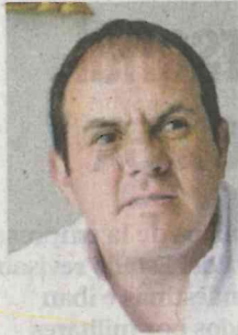
TONADA DE TWITTER