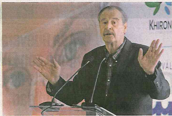
Vicente Fox Quesada

La administración federal ha dado a conocer el concepto "Nueva Escuela Mexicana" para referirse a su concepción filosófica de la educación pública en el país. El nombre no está mal, pero no es muy original y tendría que darle crédito a su impulsor inicial, nada menos que ¡Vicente Fox! Resulta que fue su administración la que primero utilizó el nombre "Nueva Escuela Mexicana" como consta en el libro Equidad, calidad e innovación en el desarrollo educativo nacional , que por cierto editó el Fondo de Cultura Económica en 2005 y que en la portada muestra la fotografía del expresidente en un salón de clases. Así, en el capítulo IV sobre Educación Básica, página 161, uno de los subtemas reza: "Nueva Escuela Mexicana: realidad e ideario de la política educativa". Para el gobierno de Fox, la escuela debía tener recursos adecuados, autonomía suficiente y capacidad de gestión. Con la tirria que don Vicente le tiene a la 4T, no vaya a salir con una demanda por derechos de autor.