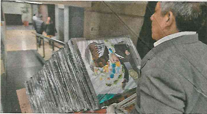
Entrega de retratos de AMLO, en San Lázaro

Quién dice que en política no hay coincidencias. Hace solo unos días el fiscal general de Estados Unidos visitó México y se entrevistó con el presidente Andrés Manuel López Obrador , y a raíz de esa charla el mandatario mexicano ha recibido tres regalos navideños. El primero, el viernes con la decisión del presidente Donald Trump de no designar a los cárteles mexicanos como organizaciones terroristas, y con ello alejar la posibilidad de operaciones policiales o militares estadounidenses en territorio mexicano. El segundo, el fin de las negociaciones del T-MEC y el compromiso de su ratificación. Y el tercero, la detención del exsecretario de Seguridad Pública federal del entonces presidente Felipe Calderón , Genaro García Luna , quien es acusado de colaborar con el narcotráfico y de recibir millonarios sobornos de Joaquín El Chapo Guzmán , este último obsequio tiene la ventaja de que puede ser usado por AMLO para cuestionar el modelo de combate al crimen de quien se ha vuelto uno de sus principales críticos, Felipe Calderón: Y por si fuera poco, también queda el mensaje de que así como se mencionó a García Luna en el juicio contra El Chapo y acabó detenido y acusado, también se mencionaron otros nombres, como el del expresidente Enrique Peña Nieto , quien nos hacen ver, preferirá mantenerse en el bajo perfil. Al final, hay tres cajas bajo el árbol de Navidad con etiquetas que dicen: De Trump, para AMLO, con cariño.