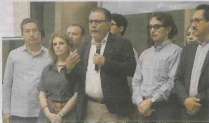
Presentación de la iniciativa Futuro 21