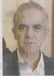
BERENICE FREGOSO, EL UNIVERSAL