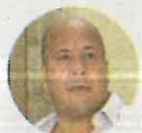
● Enrique Alfaro

Cuestión de ver que en la Cámara de Diputados el PRD le ha dado juego a tres diputadas identificadas con el exrector de