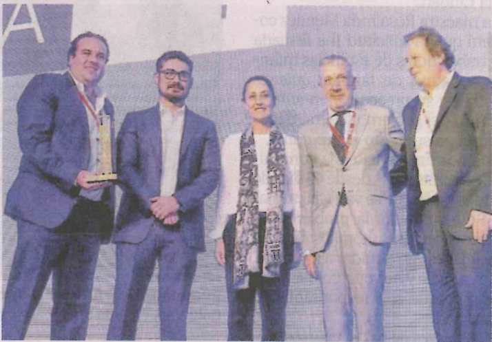
Claudia Sheinbaum y Enrique Téllez (derecha).

El asesinato a balazos del segundo regidor Rodrigo Segura Guerrero del Partido Encuentro Social (PES), encendió los focos rojos en el ayuntamiento de Atizapán de Zaragoza, donde nos comentan que el homicidio pudo ser una venganza luego de denunciar que fue víctima de una extorsión. El asesinato ocurrió, según nos platican, frente a un grupo de alumnos de su escuela de karate y de familiares; recibió por lo menos seis impactos de bala en el pecho. Esta situación, según nos dicen, es un reflejo de la inseguridad que se vive en el ayuntamiento. Por lo pronto para hoy está contemplada una conferencia de prensa de gente de Morena para tratar de explicar esta situación.