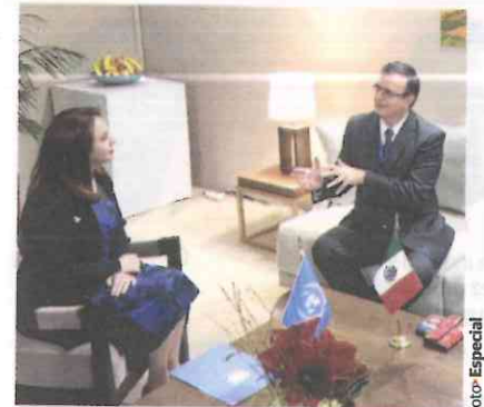
EL SECRETARIO dialoga con la representante de la ONU, ayer.

En este contexto, "el canciller participará en un evento paralelo de alto nivel organizado por la Oficina de la Representante Especial del Secretario General de la ONU para la Migración y por la Oficina del Alto Comisionado para los Derechos Humanos".