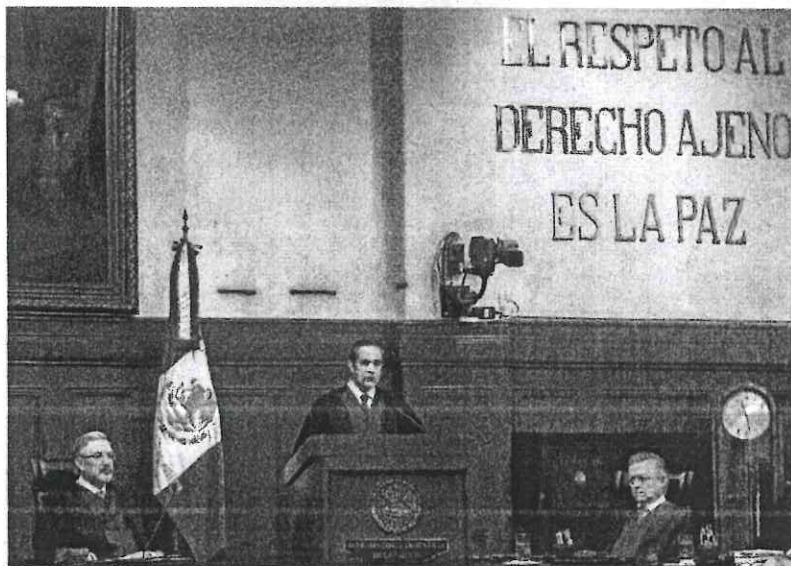
El ministro Jorge Pardo (centro) asegura que la mejor defensa de los jueces es la prudencia y dignificación de su tarea, no entrar a la batalla política.