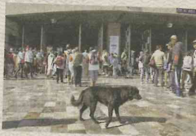
Perro abandonado en las inmediaciones de la iglesia. Especial