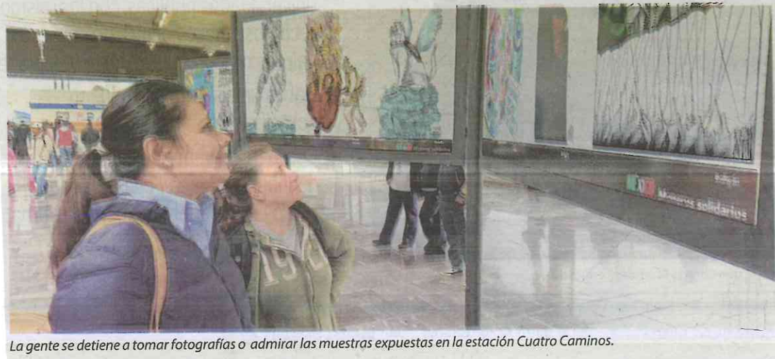
La gente se detiene a tomar fotografías o admirar las muestras expuestas en la estación Cuatro Caminos.

La imagen de la estación representa la estructura de lo que fue la cúpula del Toreo de Cuatro Caminos. En la lengua náhuatl la palabra