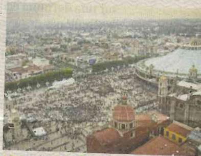
Millones de fieles continúan con la celebración en la Villa.