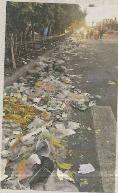
Las toneladas de desperdicio que dejan en su camino. Especial

AYER LA SEDESO repartió 31 mil 792 raciones de alimentos y 10 mil 392 cobijas para las personas que permanecieron en las áreas de descanso