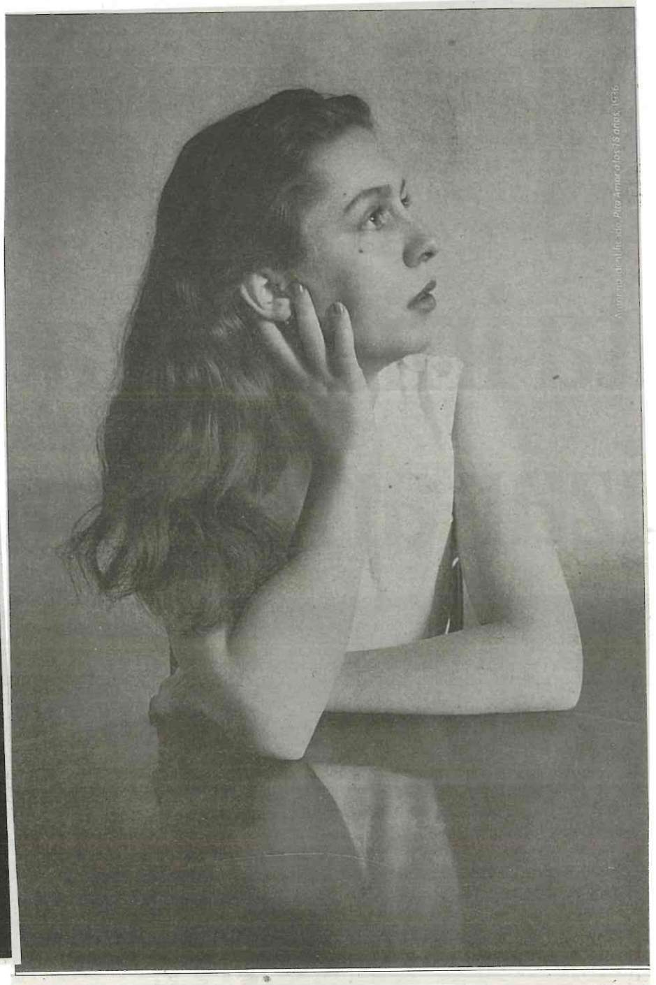
Foto: Pita Amor en el estudio de Pita Amor en los años 1930.