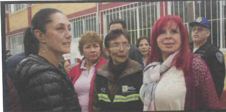
Sheinbaum estuvo acompañada por Layda Sansores.