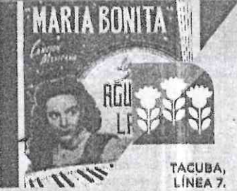
TACUBA, LÍNEA 7.