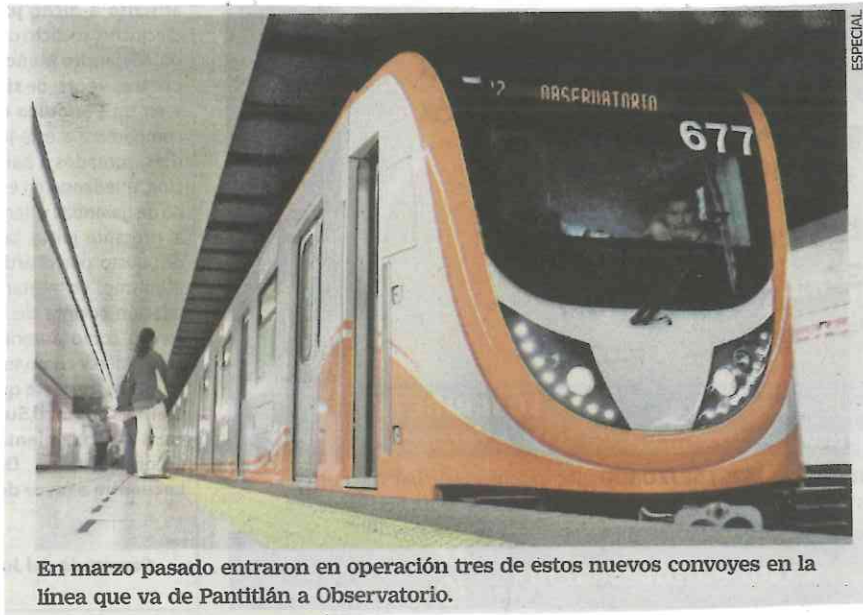
En marzo pasado entraron en operación tres de estos nuevos convoyes en la línea que va de Pantitlán a Observatorio.

Uno de ellos fue la compra de 45 trenes nuevos para la Línea 1, en donde se destinaron mil 307 millones de pesos y hasta la fecha sólo han adquirido 10 de los 45 trenes a la empresa CAF, quien nada más ha entregado cinco convoyes. ●