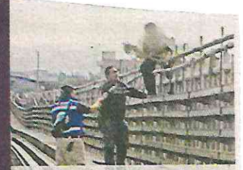
■ Un hombre intentó ayer arrojarse a vías de la Línea B.

Tras unos minutos, el personal logró rescatar y asegurar al hombre evitando su intención de arrojarse.