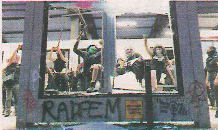
Daños millonarios al Metrobús.

Se hizo un especial reconocimiento al personal de Metrobús, empresa de limpieza, mantenimiento, permisionario y de servicios urbanos que trabajaron arduamente durante la noche para rehabilitar la