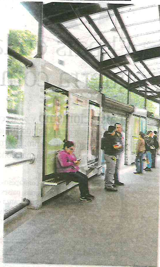
La estación de Insurgentes del Metrobus quedó restaurada

"Eso lo vamos a estar trabajando, lo hemos venido haciendo y los vamos a reforzar, a partir de mañana (domingo) ha-