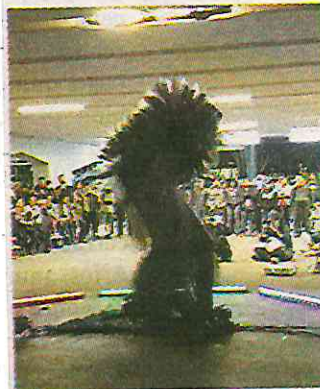
El performance puso fin a las actividades

Las vitrinas culturales de la estación Chabacano, Línea 9, alojan la exposición “De lo Femenino”, diferentes universos femeninos