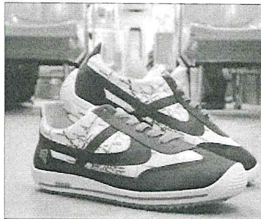
Esta es una edición especial a la venta desde el pasado 10 de diciembre en tiendas físicas de la capital mexicana y en tienda en línea.

El modelo conmemorativo del Metro fue diseñado en conjunto por los creativos de Panam y personal del Sistema de Transporte Colectivo.