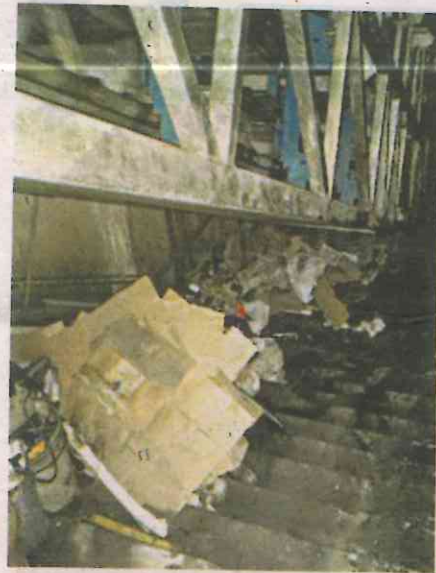
Estos desperdicios fueron hallados en los motores de las escaleras revisadas

Fue en las estaciones Patriotismo, Camarones y Tacubaya, de la Línea 7, así como Balderas de la Línea 3, donde se hallaron los elementos de desecho, bolsas de plástico y elementos mecánicos en malas condiciones.