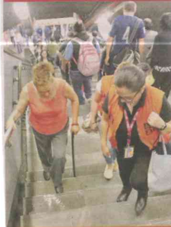
■ Empleados del Metro ayudan a usuarios de la L-7.

Al concluir la revisión notó que las escaleras estaban en malas condiciones con problemas de fábrica y de mantenimiento.