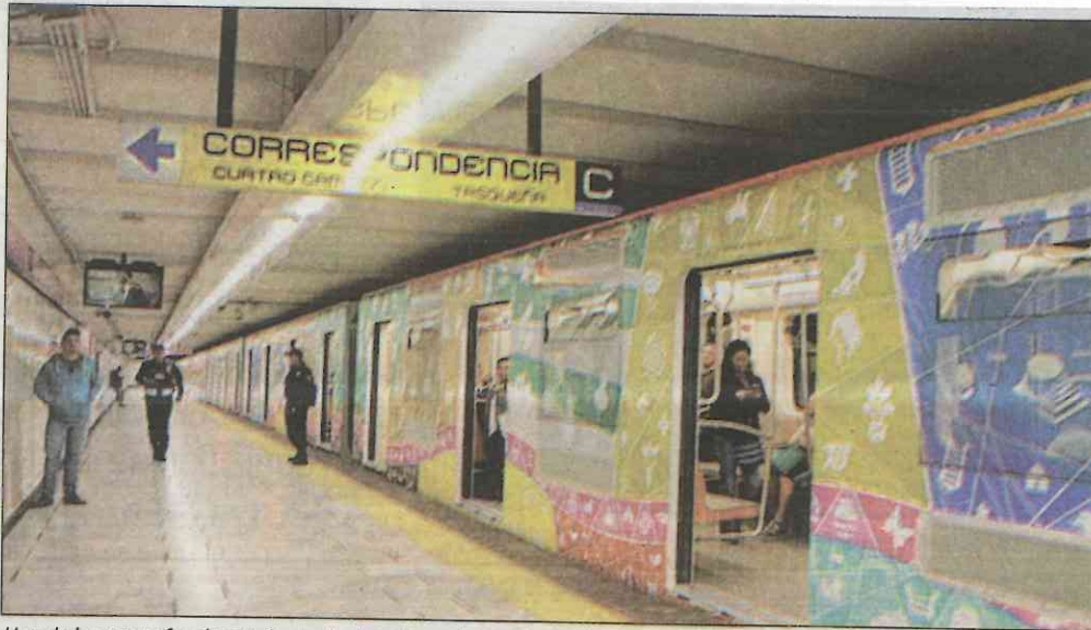
Uno de los trenes fue decorado con los logotipos de estaciones de las diferentes líneas y es conocido como Quetzalcóatl.

la empresa francesa CAF debió diseñarlos para que se pudieran adaptar a la tecnología análoga pasada, que es con la que cuenta la Línea 1 del Sistema de Transporte Colectivo (STC).