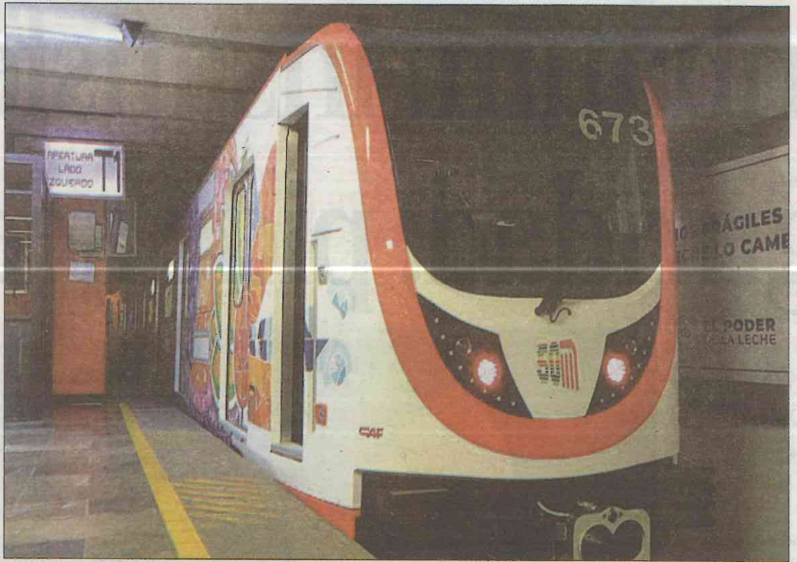
La adquisición de los nuevos trenes se debe al 50 aniversario del Metro.

Tanto la mandataria local, como la titular del Metro y el secretario de movilidad hicieron un breve recorrido: iniciaron en Balderas y descendieron en Pino Suárez. Posteriormente transbordaron a la línea