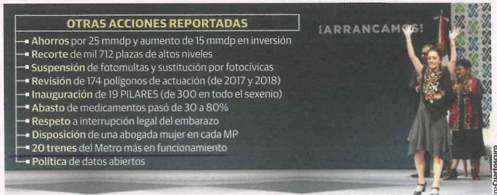
CLAUDIA SHEINBAUM, ayer, en el Teatro de la Ciudad.