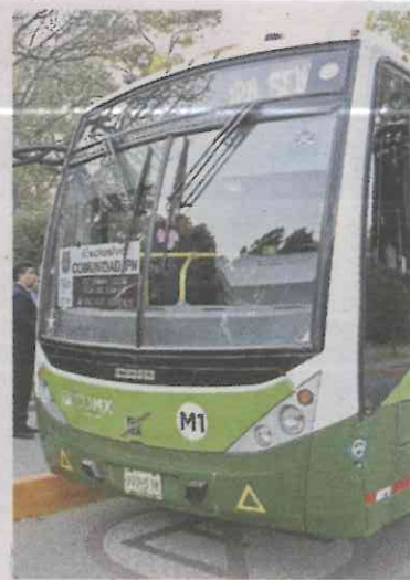
Las unidades RTP harán la ruta de la Línea 7.

Usuarios deben subir más de 120 escalones para llegar a la calle.