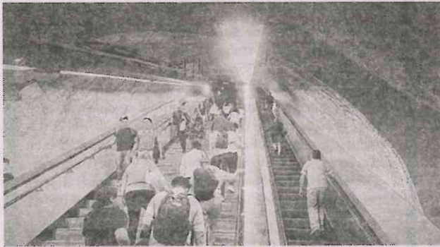
Las personas de la tercera edad con alguna discapacidad o mujeres embarazadas, pueden utilizar de forma gratuita las unidades de la RTP.

Recordó, las personas de la tercera edad con alguna discapacidad o mujeres embarazadas que así lo requieran, pueden utilizar de forma gratuita las unidades de la RTP, que cada 30 minutos inician su recorrido en el tramo Barranca del Muerto-Aguiles Serdán, con un tiempo de espera de tres minutos en cada estación de la Línea 7.