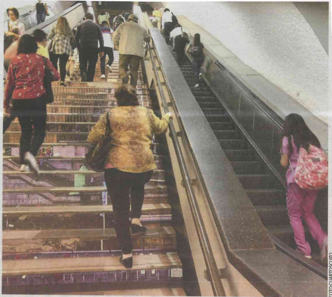
Las primeras escaleras en ser activadas serán las de subida.

A través de una tarjeta informativa, el sistema de transporte detalló que tales medidas fueron tomadas "con base en los avances registrados en el programa de inspección y mantenimiento a las 85 escaleras electromecánicas".