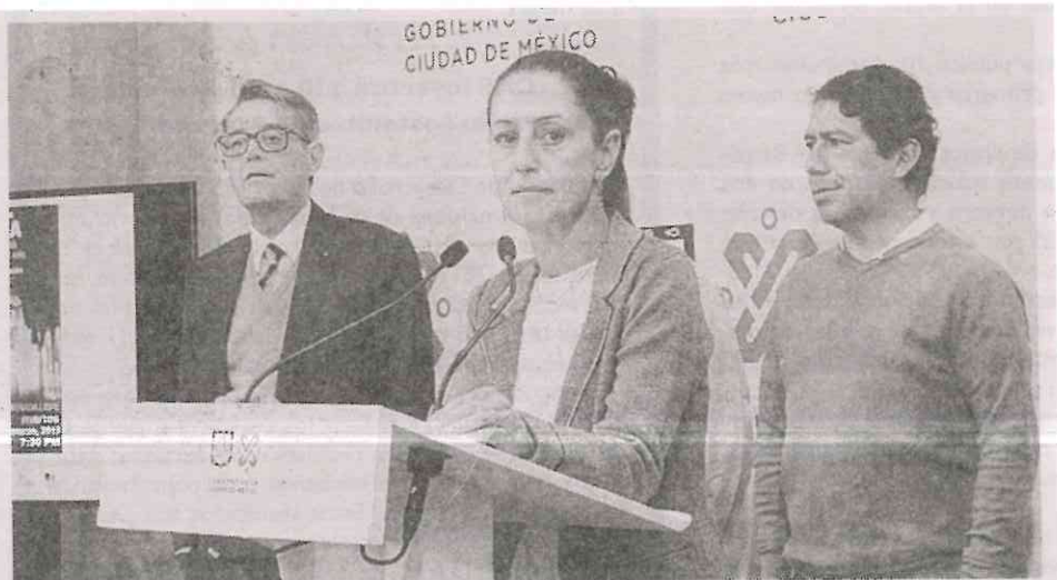
El festival consta de la presentación de 90 talentos nacionales y dos internacionales con conciertos de música de jazz, blues, salsa, entre otros.

Adelantó que este jueves se inaugurará el Jardín Cultural de Primavera en la plancha del Zócalo capitalino, la exposición estará abierta al público de manera gratuita y se retirará pasados 11 días.