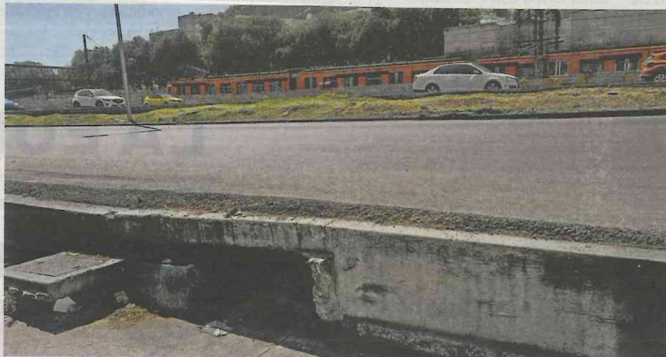
DESCENSO. En ciertas zonas de Avenida Zaragoza, por donde corre la Línea A, se puede observar cómo la banqueta ha quedado debajo del nivel del arroyo vehicular por el hundimiento en la zona.

30 a 40 centímetros por año, es el máximo, en la zona del antiguo lago de Texcoco, debido a la extracción de agua