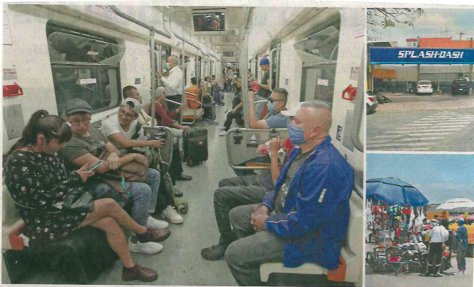
En el Metro se ve más gente usando cubrebocas, pero no se acatan las recomendaciones de la sana distancia, a pesar de la baja de usuarios; en las alcaldías, negocios no prioritarios siguen abiertos y en Toluca los ambulantes argumentan que "si no salen, no comen".