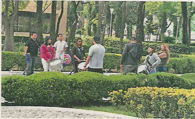
En el parque de la alcaldía Iztacalco bajó el número de jóvenes; ayer, integrantes de una banda de guerra aprovecharon el tiempo para ensayar.

Indicó que la gente se traslada menos en Metro y Metrobús, pero